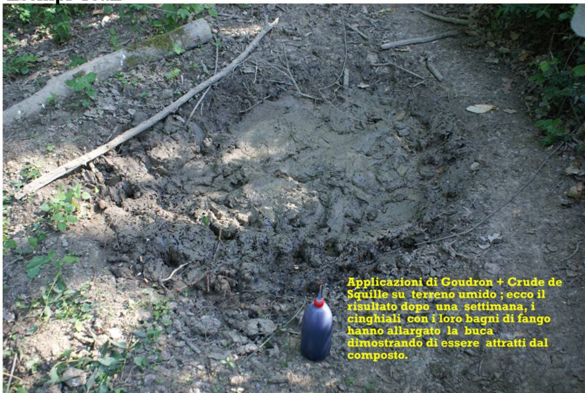
Applicazioni di Goudron + Crude de Squille su terreno umido ; ecco il risultato dopo una settimana, i cinghiali con i loro bagni di fango hanno allargato la buca dimostrando di essere attratti dal composto.